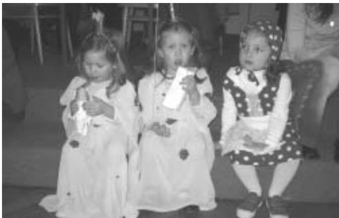
I pohádkové bytosti mají hlad.