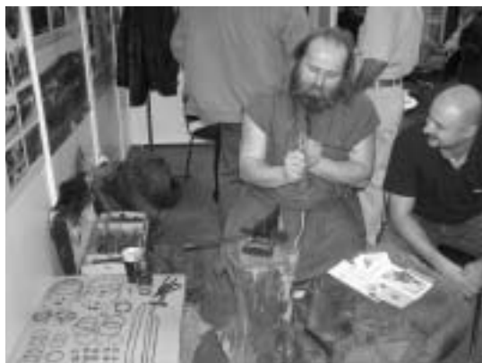
Vikingové zavítali také na veletrh Regiontour 2007, kde byli našimi milými sousedy.

Keltská usedlost ISARNO, Letovice, Česká ul. pí. Simona Hrušková, A. Krejčího 6, 679 91 Letovice tel.: 776 117 537, 776 636 580 e-mail: isarno@isarno.com web: http://www.isarno.com