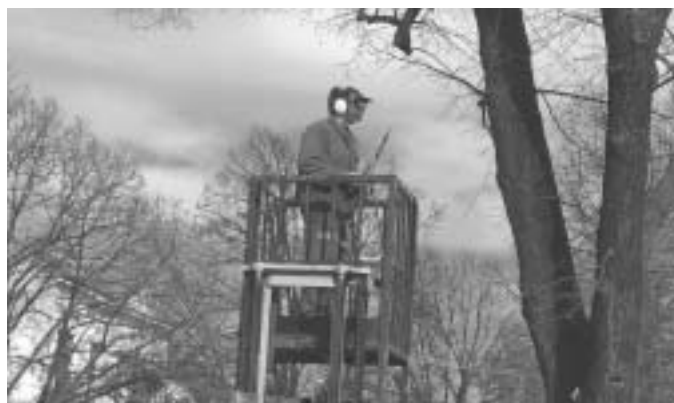
Průřezávání větví stromů.

Na počátku jarních měsíců se pracovníkům města podařilo vysadit více než 300 ks vzrostlých stromů podél polních cest. Po několika letech tyto stromy vytvoří vstupní brány do našeho města a budou poskytovat dostatek stínu pro cyklisty i kolemjdoucí. Nejvýznamnější stavbou v oblasti životního prostředí je zahájení odbahnování rybníku. V uplynulých týdnech se práce zastavily z důvodu poruchy bagru. Město Velké Pavlovice má s dodavatelem stavby podepsanou smlouvu s dokončením všech stavebních prací do konce září 2007. Akce je průběžně hodnocena na kon-