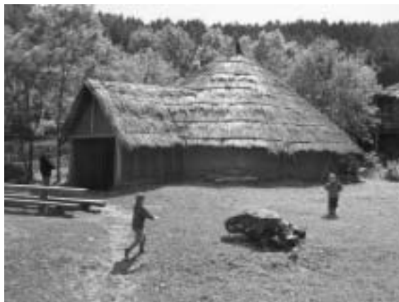
ISARNO – Keltská hospoda.